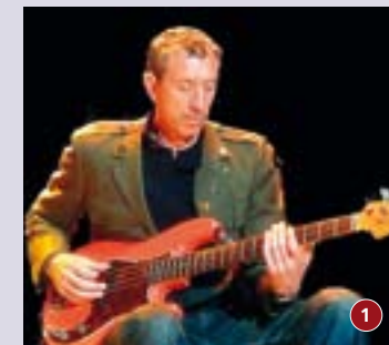
1. Pino Palladino