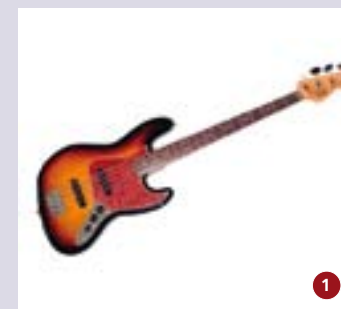
1. Fender Jazz