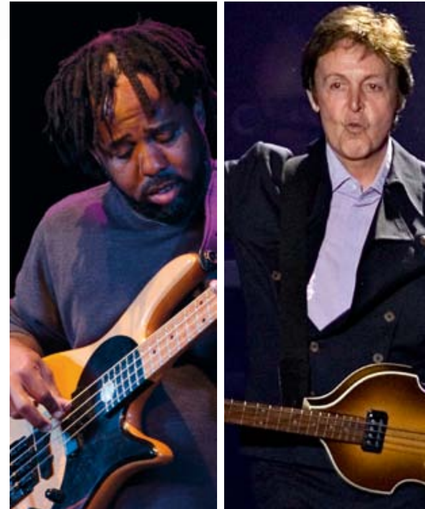
Goed voor een gedeelde tweede plaats: Victor Wooten & Paul McCartney

Tja, als je het hebt over de Fender Jazz of de Fender Precision, kom je in de eeuwenoude bassistendiscussie terecht, vergelijkbaar met het gesteggel over The Beatles en The Stones. Binnen de redactie van De Bassist woedt al jaren een tweestrijd en de discussie loopt nog regelma-